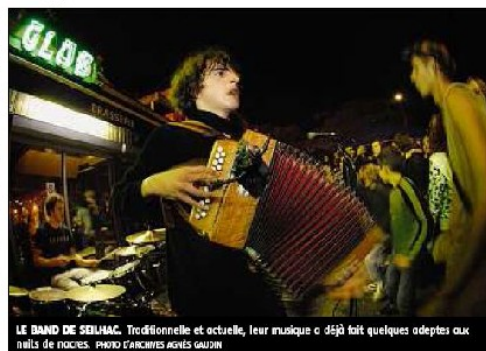
LE BAND DE SEILHAC. Traditionnelle et actuelle, leur musique a déjà fait quelques adeptes aux Naves de Naves.

En descendant des Montagnes, le Band de Seilhac a vu son évolution, avec leur nouveau folklore qui emprunte autant aux musiques traditionnelles qu'au ska ou au punk, ces quatre musiciens réinventent une musique qui donne envie de « guincher » aux nouvelles générations. À de son côté, le quartier seilhacois s'est réapproprié la musique de leurs ancêtres pour la con-