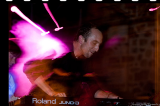
>> DCDT 2009@FDLM