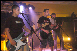
DCDT 2008@Naves Be Punk