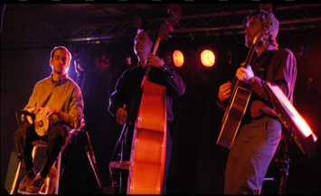
DCDT 2008@Folclor en Avença