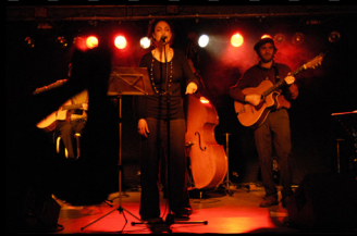
>> DCDT 2008@Folclor en Avença