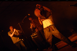
DCDT 2008@Folclor en avença